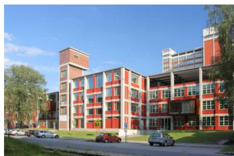
Sídlo RPZ je v budově PIC Zlín