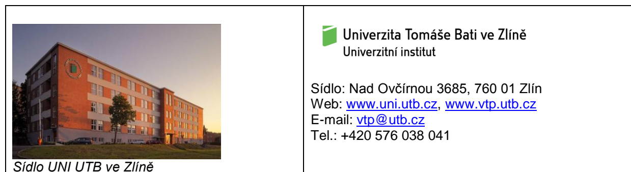
Sídlo UNI UTB ve Zlíně